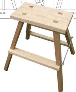
教材：四方転び踏み台